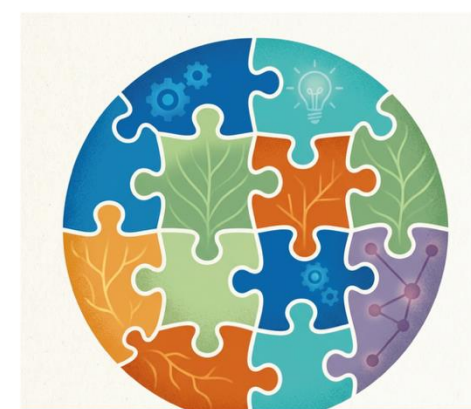
KOLLEGIALITÄT & MITEINANDER