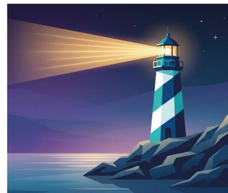
VERANTWORTUNG & VORBILD