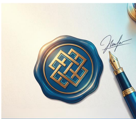
VERBINDLICHKEIT & KONSEQUENZ