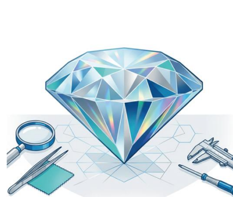
QUALITÄT & PROFESSIONALITÄT