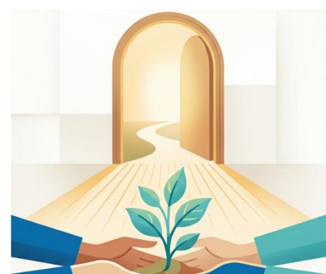
MENSCH IM MITTELPUNKT